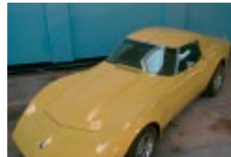
DE CASE VAN DE CORVETTE

De fiscale adviezen worden toegespitst op uw persoonlijke situatie en worden vervolgens verwerkt in de aangifte. Deze fiscale aangiften zijn het sluitstuk van het belastingjaar en voor u als cliënt van wezenlijk belang.